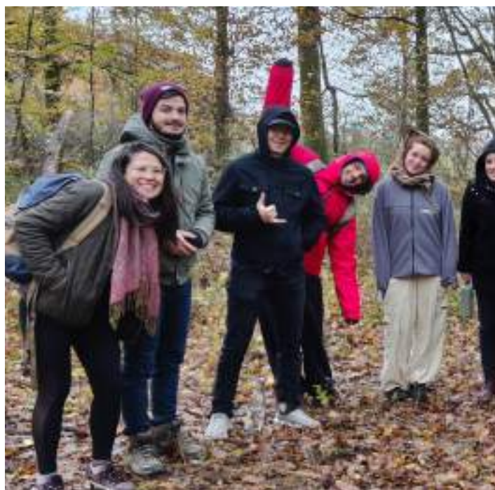
L'équipe exploration sensorielle après sa balade en forêt