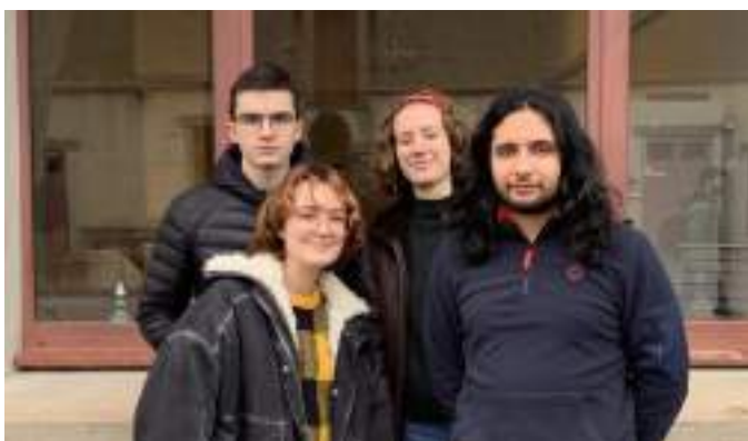
La team JED de Jets d'encre !